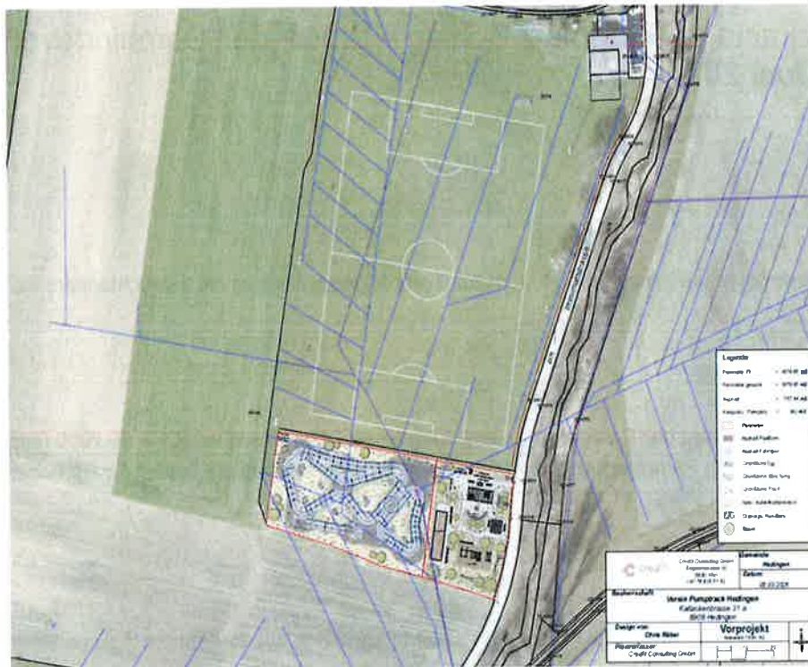
Abbildung 1: Einbettung Pumptrackanlage und Freizeitbereich im Sportplatz Schlag.