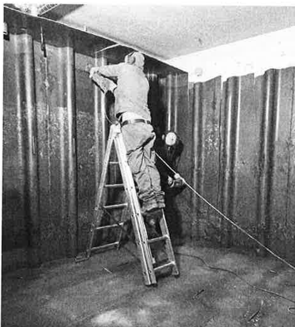
Die Entfernung des alten Öltanks ist eine lärmige Angelegenheit